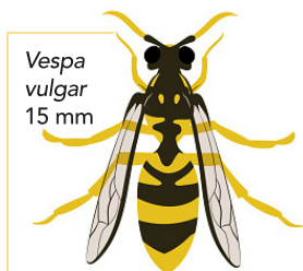
Vespa vulgar 15 mm

A vespa velutina é mais escura na zona anterior do corpo, tem as pontas das patas amarelas e apenas uma espessa faixa amarela ou alaranjada na parte final do abdómen.