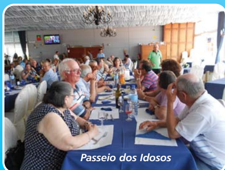
Passeio dos Idosos