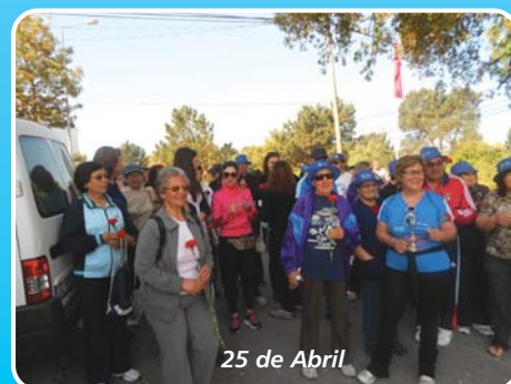
25 de Abril